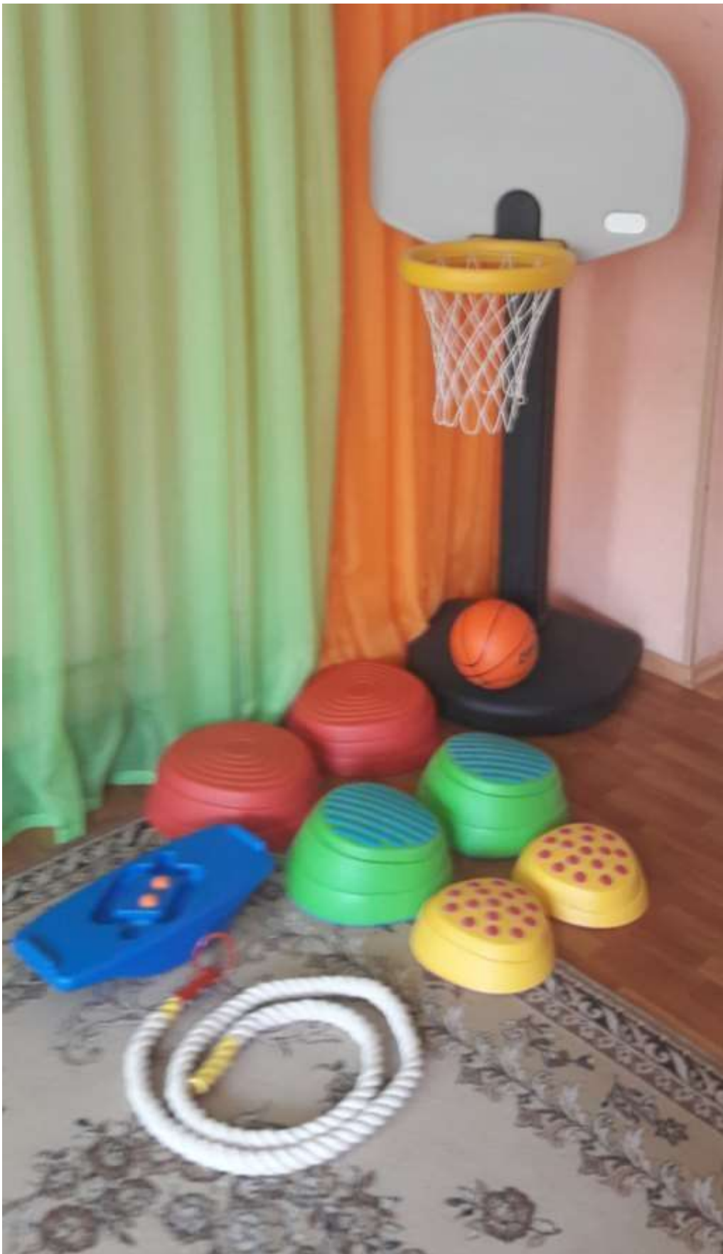
Оборудование по «Физическому развитию» в музыкально – физкультурном зале: